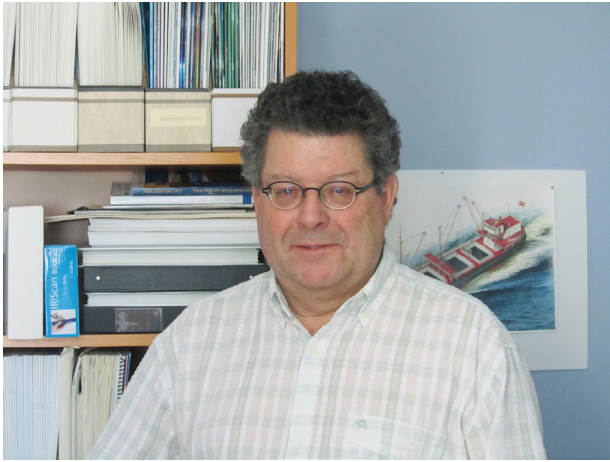
Louis Blanchette

Historien, écrivain ou éditeur... On a le choix!!!