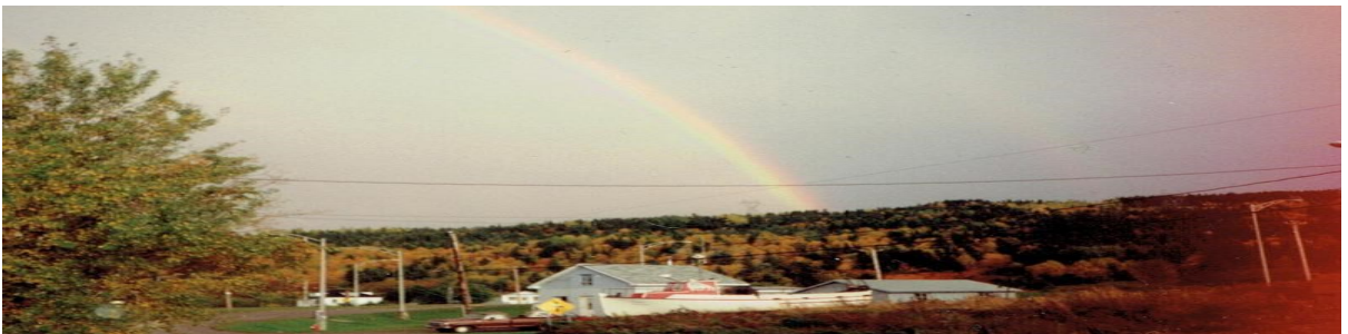
Superbe paysage d'automne et bel arc-en-ciel.

Ces travaux nous offrent une nouvelle avenue de développement touristique et domiciliaire. Nous devons prendre avantage de cette ressource de développement pour attirer de nouveaux résidents, de petites entreprises et offrir de nouvelles possibilités aux propriétaires de lots et de terrains de cette partie importante de notre communauté.