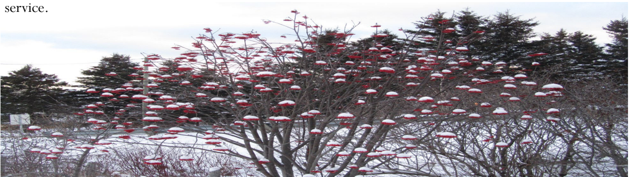
Au menu, sorbets de neige sur fruits de cormier.

L'Œil Ouvert sur Grosses-Roches vous donnera mensuellement les informations nécessaires pour utiliser le service.