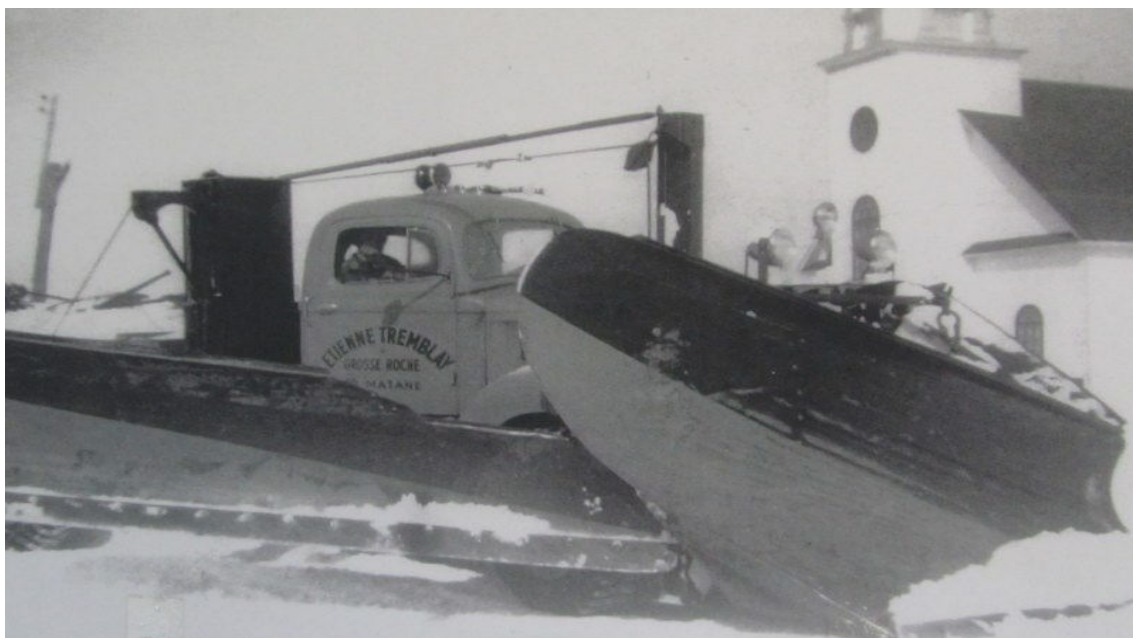
Photo du haut : Chasse-neige d'Étienne Tremblay. Celle du bas : Les deux hommes vaillants sont Cérénius Coulombe et son fils Lionel à leur maison du 4 et 5 de Grosses-Roches après une tempête en avril 1963.

On est prêts pour un bon hiver de neige!